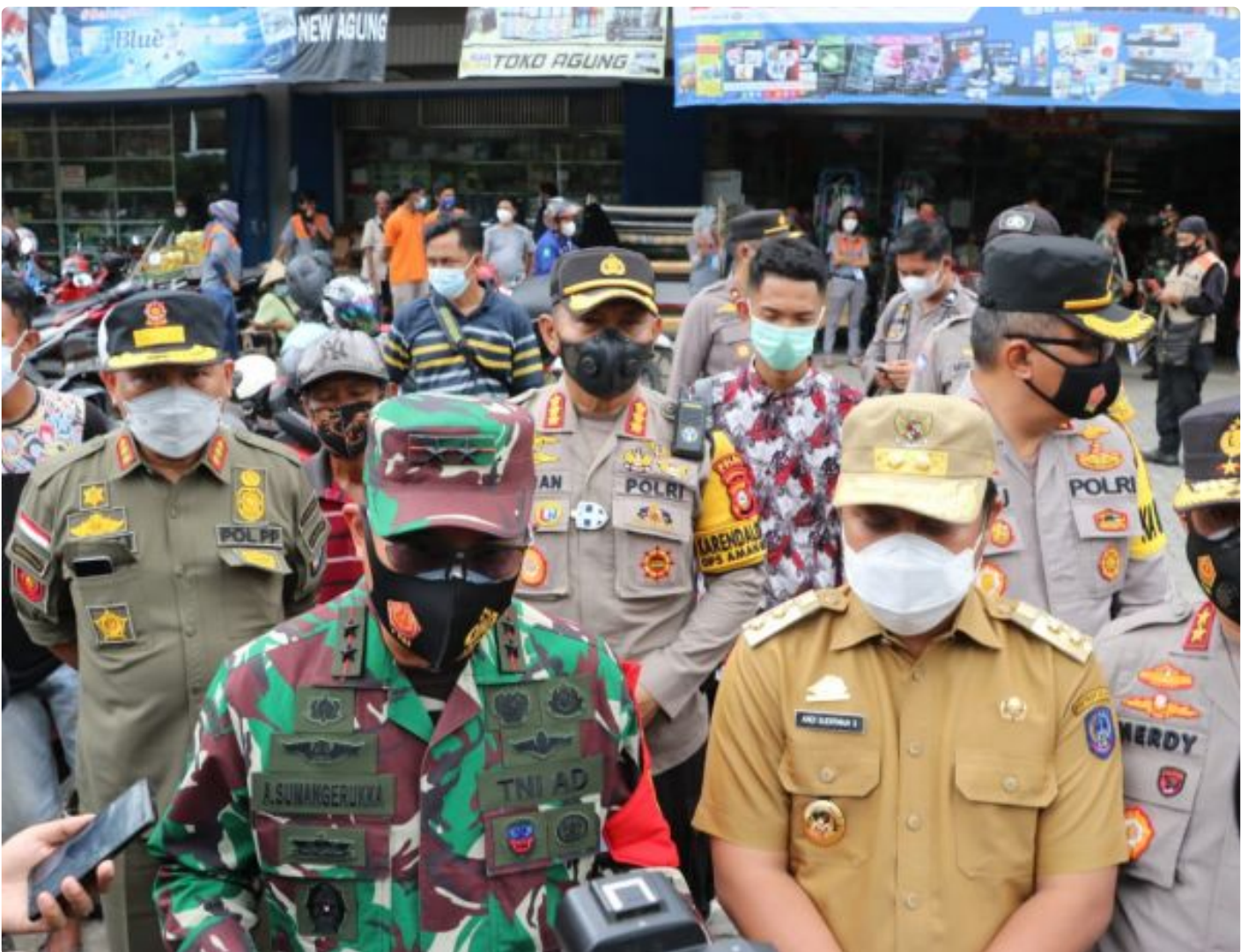
Kapolda Sulsel bersama Gubernur dan Pangdam XIV Sidak Protokol Kesehatan Masyarakat Kota Makassar